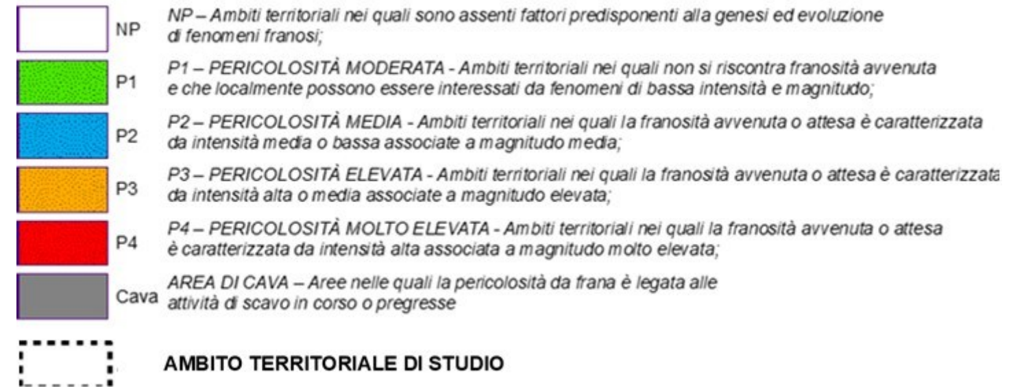
STRALCIO CARTA DEL RISCHIO DA FRANA (modificata)